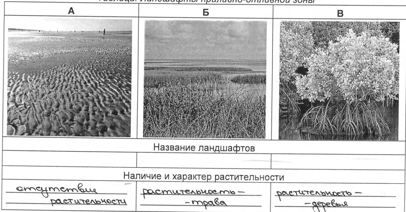
Таблица. Ландшафты приливно-отливной зоны

Как ландшафт Б называется на севере Европейской России? _____